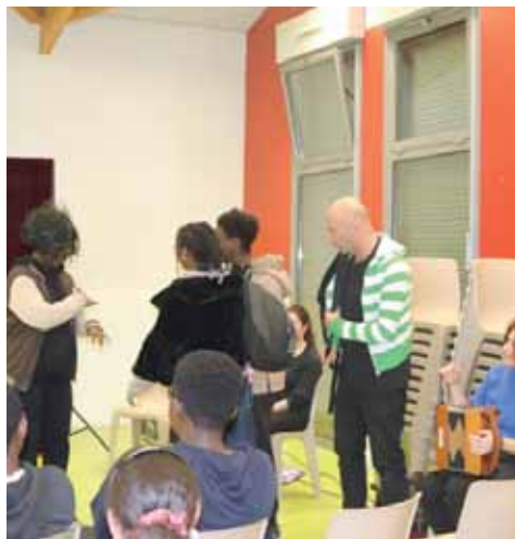
Lors d'un théâtre forum jeudi 26 octobre au relais jeunesse Pablo Picasso, jeunes et acteurs ont joué des saynètes pour réfléchir aux meilleures manières de lutter contre le harcèlement.