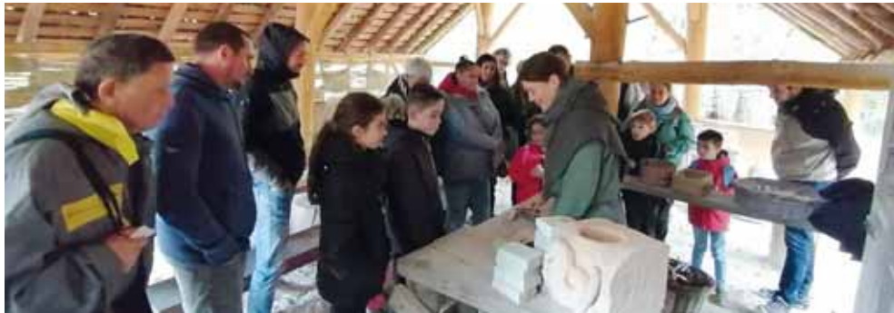
Devant l'enthousiasme généré par les « Sorties pour tous » de l'été, la Municipalité a organisé une passionnante journée à Guédelon samedi 21 octobre, avec toujours le même succès !