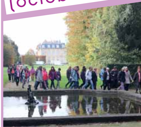
Marche solidaire contre le cancer vendredi 27 octobre dans le parc du château à l'occasion de la campagne nationale « Octobre Rose ».