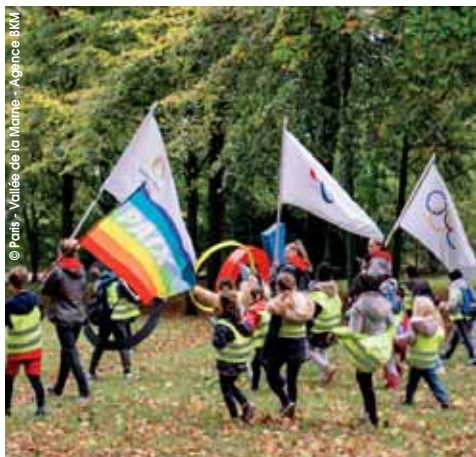
Mercredi 25 octobre pour la Toumée des Drapeaux Olympiques, habitants et enfants des accueils de loisirs ont déambulé depuis le Centre Aquatique Intercommunal jusqu'au mail Jean Ferrat, où les attendaient les animations sportives du village olympique municipal.