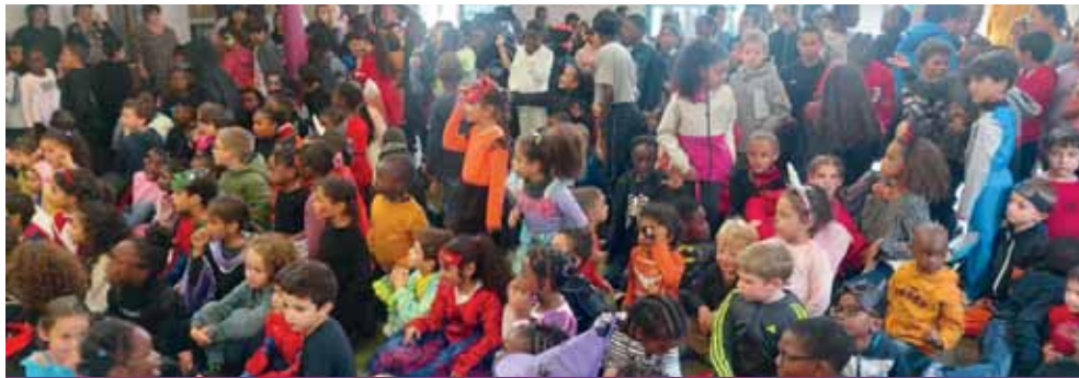
Vendredi 20 octobre dans le cadre de la « Semaine du goût », le déjeuner était délicieusement effrayant à l'école Pablo Picasso pour les enfants fréquentant la restauration scolaire.