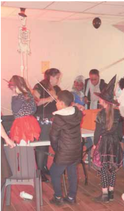
Préparée depuis le mois de septembre par les habitants au LCR Edouard Branly, la fête d'Halloween a fait frissonner petits et grands samedi 28 octobre à la salle Jean Effel !