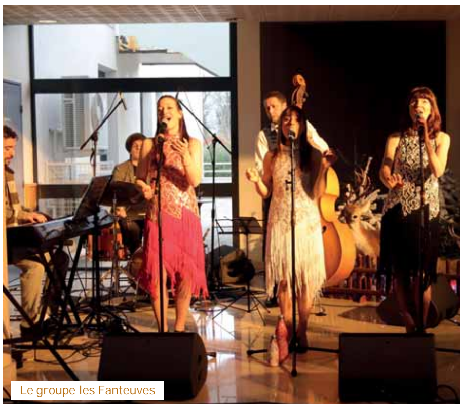
Le groupe les Fanteuves