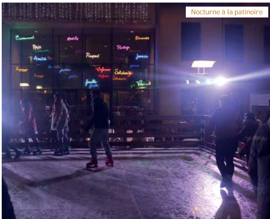
Nocturne à la patinoire

dégustation de tous les Campésiens leurs galettes : Aube pâtisserie et Aux délices du Château, qui a remporté la première médaille remise par Madame le Maire (lire page 19). Le concert très swing des Fanteuves et les cartes de vœux confectionnées par tous les participants ont donné le LA pour un beau début d'année