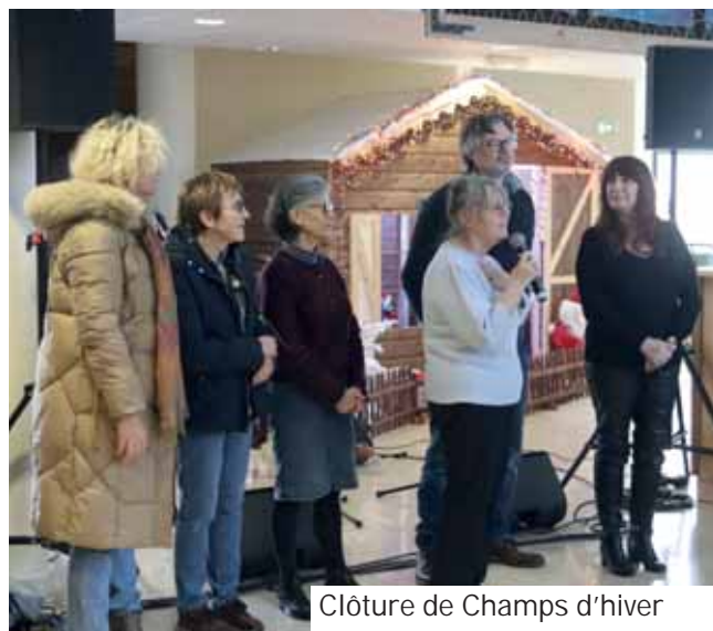
Clôture de Champs d'hiver et bons vœux du maire et de la municipalité le 5 janvier.

Sessions « bébés pinceaux » organisées par le service Petite enfance pour partir à la découverte des arts plastiques.