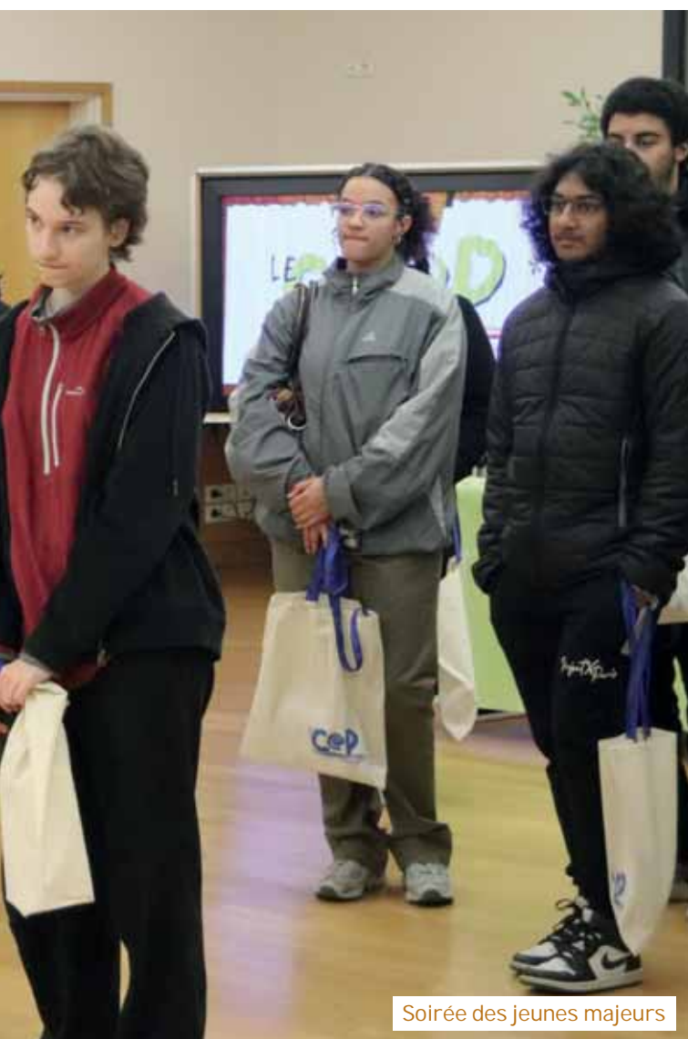
Soirée des jeunes majeurs

À la Fontaine aux Coulons, une bonne partie des modules sont déjà en place sur le chantier du wheelpark. Madame le Maire et l'élu aux sports ont constaté l'état d'avancement de l'équipement sportif municipal qui accueillera prochainement toutes sortes de pratiques de glisse urbaine, comme le BMX, le skate, le roller freestyle, etc., y compris pour les porteurs de handicap, comme avec le WCMX wheelchair Motocross.