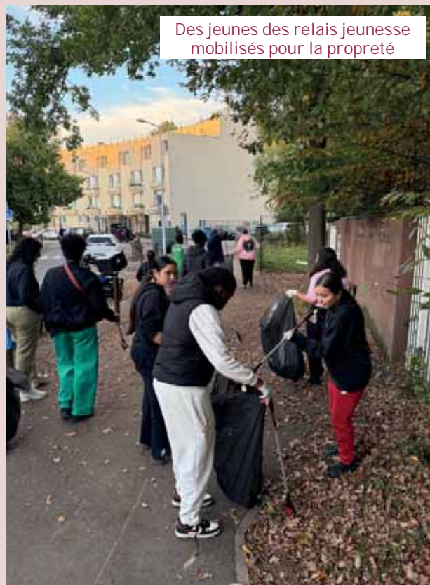
Des jeunes des relais jeunesse mobilisés pour la propreté

Champs-sur-Marne met en place diverses actions pour bien vivre ensemble au sein de la commune. Ces initiatives visent à améliorer la qualité de vie quotidienne des habitants, en agissant sur des aspects essentiels comme la propreté, la sécurité, et l'entretien des espaces publics. Ces efforts nécessitent aussi la participation active de chacun pour préserver l'harmonie et garantir un cadre de vie agréable et respectueux pour tous.