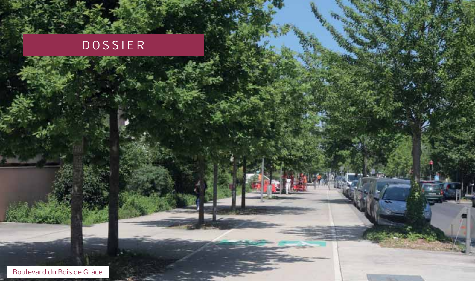
Boulevard du Bois de Grâce