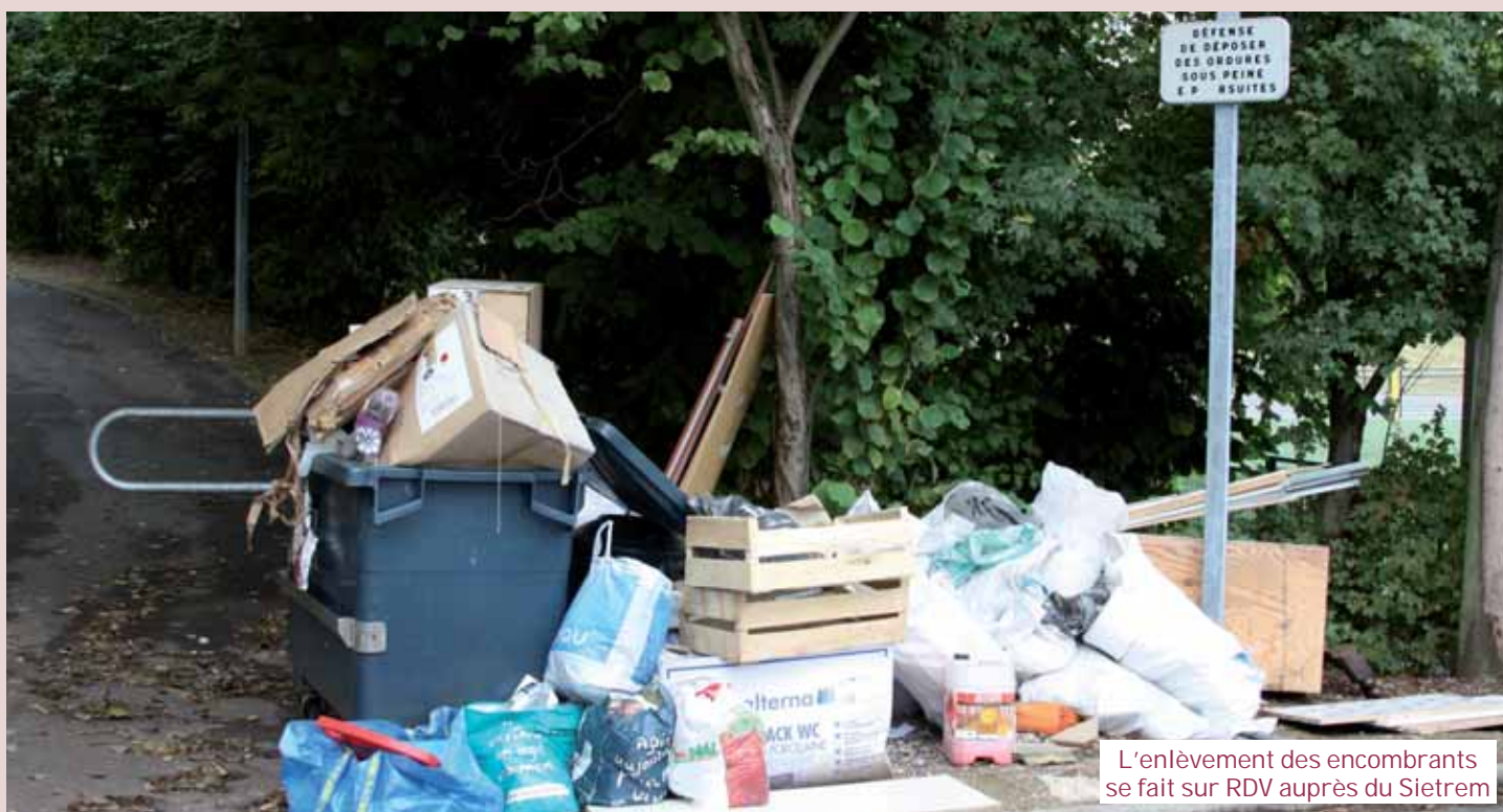
L'enlèvement des encombrants se fait sur RDV auprès du Sietrem

Puisque « Dehors c'est aussi chez nous », le fait de protéger l'environnement est l'affaire de tous. En respectant les autres et les services municipaux, nous agissons pour le bien de la communauté.