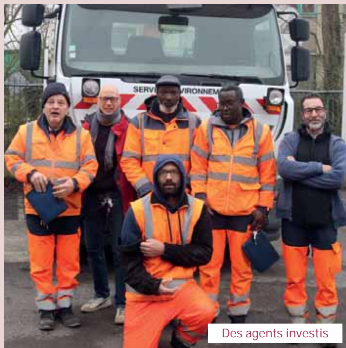
Des agents investis

Chaque citoyen a aussi sa part de responsabilité. Les dépôts sauvages, tels que les déchets laissés sur la voie publique ou dans les espaces verts, sont une source de pollution et d'insalubrité. L'appel à un civisme renforcé est donc essentiel pour éviter bien des désagréments, comme marcher entre des emballages de burgers au sol, des canettes,... Les petits déchets, tels que papiers, mouchoirs, mégots nous paraissent anodins. Pourtant, un chewing-gum par exemple met 5 ans à se dégrader.