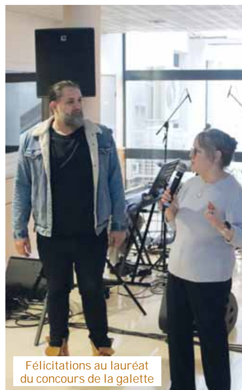
Félicitations au lauréat du concours de la galette