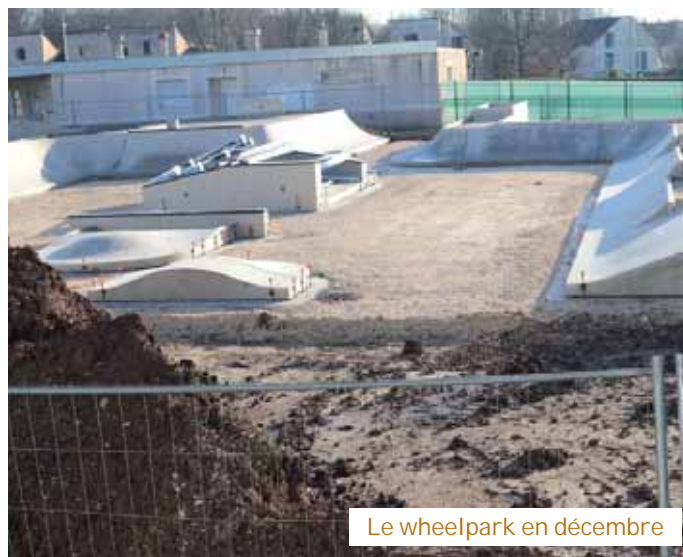
Le wheelpark en décembre

À la Fontaine aux Coulons, une bonne partie des modules sont déjà en place sur le chantier du wheelpark. Madame le Maire et l'élu aux sports ont constaté l'état d'avancement de l'équipement sportif municipal qui accueillera prochainement toutes sortes de pratiques de glisse urbaine, comme le BMX, le skate, le roller freestyle, etc., y compris pour les porteurs de handicap, comme avec le WCMX wheelchair Motocross.