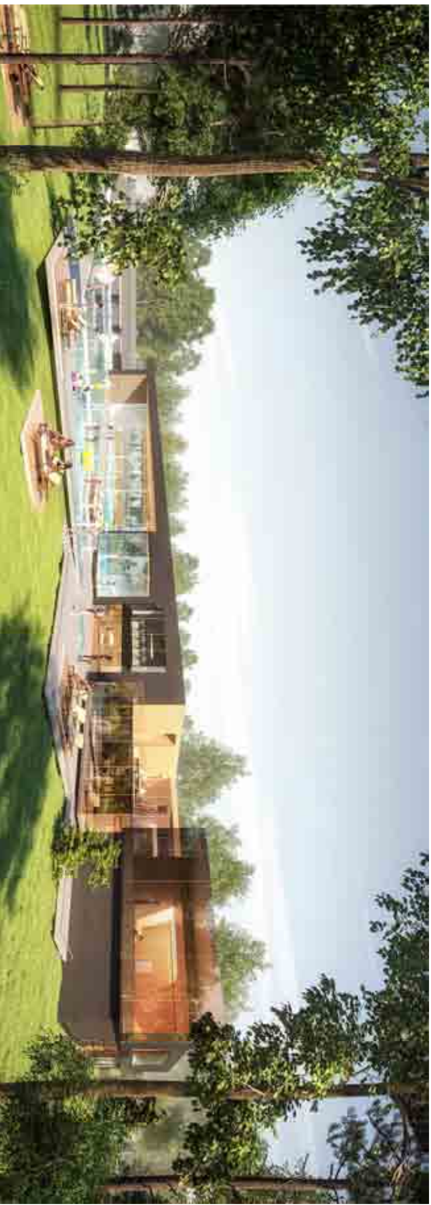
VUE 02 : VUE SUR LE BASSIN ET LES PLAGES EXTERIEURS