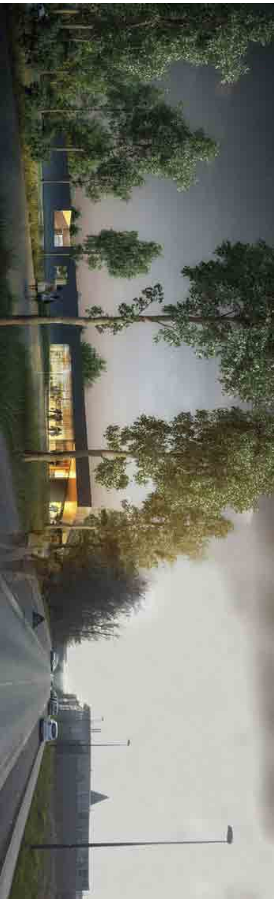
VUE 01 : VUE DEPUIS LE PARVIS : ACCES PRINCIPAL AU CENTRE AQUATIQUE