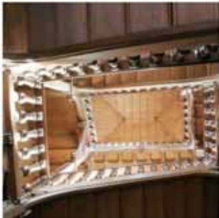
Allier - MOULINS - Maison Mantin - (2006-2007)