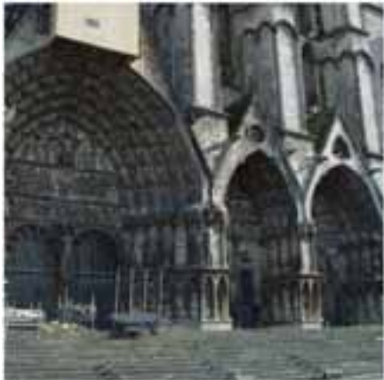
Cher - BOURGES - Cathédrale-

Portail du transept Sud: test de nettoyage Laser.