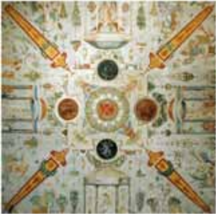
Yonne - ANCY-le-FRANC - Château -

Assistant maîtrise d'ouvrage pour le diagnostic du château et de l'ensemble de la propriété. Mise en sécurité. Inventaire des décors Définitions des besoins et des études.