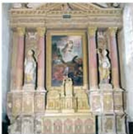
Indre et Loire - St PATERNE RACAN - Retables -

Etude préalable à la restauration des deux retables. Recherche des causes des dégradations de la pierre de tuffeau. Etude des polychromies. Rédaction du cahier des charges des travaux.