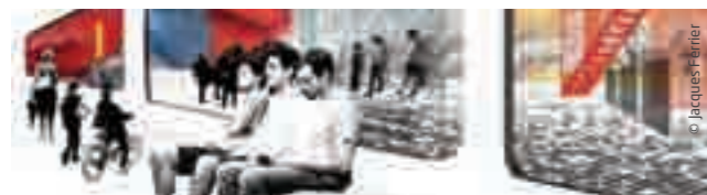
Concept de « gare sensuelle » proposé par l'architecte Jacques Ferrier.

Les gares du Grand Paris offriront à tous les voyageurs des espaces de transport à la fois efficaces et fonctionnels, sûrs et agréables. Les gares offriront des connexions avec l'ensemble des modes de transport, du Transilien à la marche à pied. Elles contribueront à améliorer la qualité de vie des habitants et des usagers en leur apportant des services et commerces complémentaires.