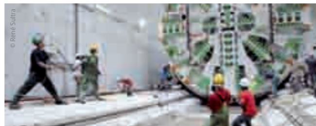
Les travaux réalisés au tunnelier permettront de limiter les impacts sur la ville.

Tout au long du chantier, les riverains, les commerçants, les usagers de la voirie et des transports publics seront régulièrement informés de l'avancement des travaux, des perturbations et des mesures d'accompagnement mises en place.