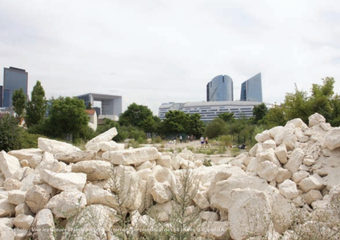
Photo : Vive les Groues à Nanterre, premier terrain d'implantation des 68 arbres d'Appel d'Air